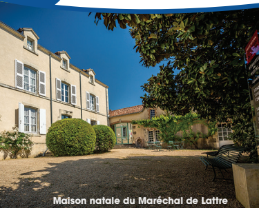
Maison natale du Maréchal de Lattre