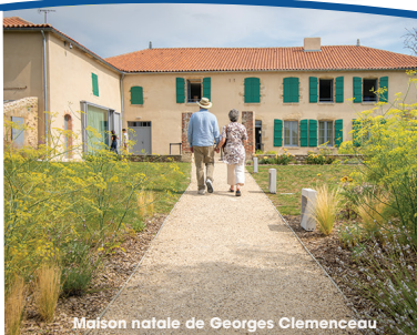
Maison natale de Georges Clemenceau