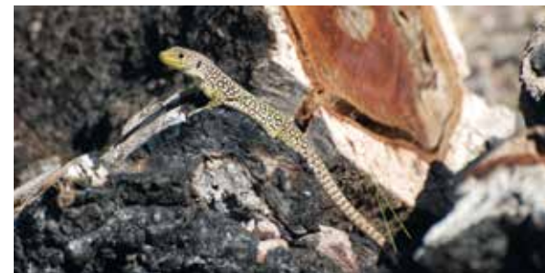
Le lézard ocellé

Les reptiles apprécient les falaises du site pour se chauffer au soleil : lézard vert, tarente des Maures, couleuvres, tortue d'Hermann et le fameux lézard ocellé. Une grotte, ancienne galerie exploitée par l'homme pour la production de grès, offrait jadis un abri aux chauves-souris de type oreillard. Elles vivent aujourd'hui dans les forts. Quelques petits mammifères, peu nombreux en raison de la forte fréquentation humaine, sont aussi présents : lapins, blaireaux, renards, écureuils. Plusieurs espèces de rapaces fréquentent la Colle Noire dont le faucon crécerelle, la buse variable et le hibou grand-duc. Sur le massif, des mares temporaires constituent des petits écosystèmes riches et précieux, plantés de massettes et de joncs. Ces habitats humides accueillent la rainette méridionale, des libellules et des bécasses.