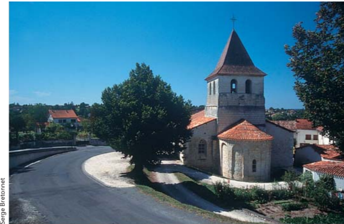
Collégiale Notre-Dame de Ribérac

L'ancienne église Notre-Dame est devenue une salle d'expositions et de concerts, un bel exemple de sauvegarde et de réhabilitation du patrimoine local pour cet édifice qui devient ainsi un lien de première importance dans le programme de développement culturel de Ribérac.