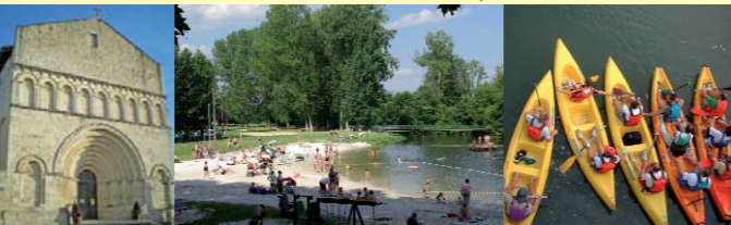
Porte du Périgord Vert, pour des séjours paisibles, festifs et actifs !