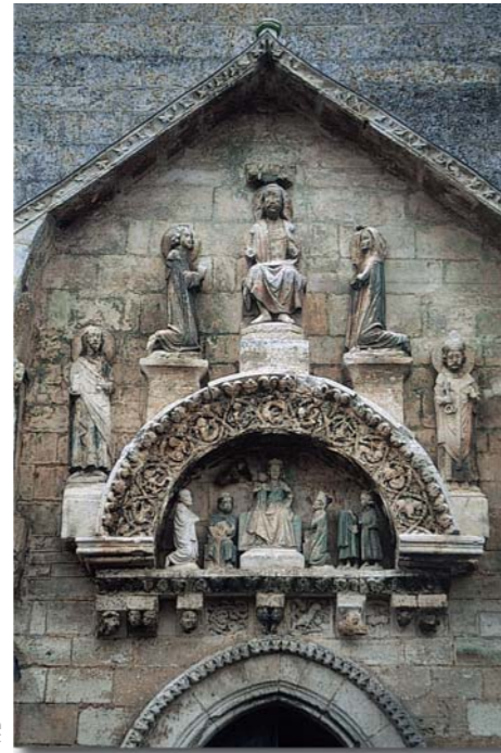
Portail de l'église de Grand Brassac

D'après Jean SECRET, « L'Art en Périgord ».