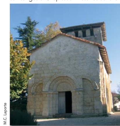
Église de Faye

Église Sainte-Eulalie du XII e . Plan cruciforme. Façade décorée dans le style saintongeais. Chapiteaux historiés dans le chœur. La croisée du transept était